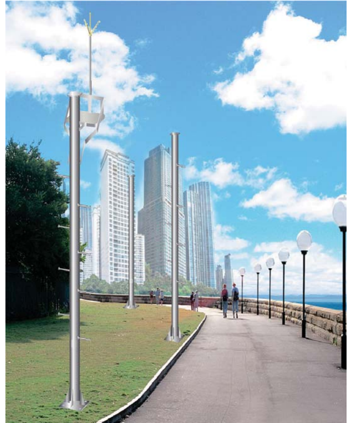
본 제품은 성능향상을 위해 사전에 예고없이 외관 및 성능이 변경될 수 있습니다.